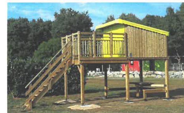
Cabane au camping de Beslé, pour les pèlerins !! (prise électrique dans chacune des deux cabanes).

Au Mont-Saint-Michel, il est possible de loger intra-muros à la maison du pèlerin. Il est indispensable de réserver suffisamment tôt cet hébergement. 02 33 60 14 05 ou sanctuaire.saint.michel@wanadoo.fr